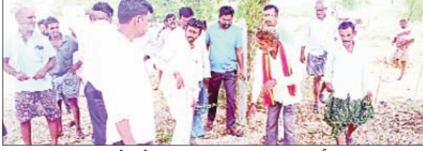
ఎన్నుకున్నారు. కొనుగోళ్లలో ఎలాంటి సమస్య ఉన్న కమిటీకి విన్నవించాలని తీర్మానం చేశారు.